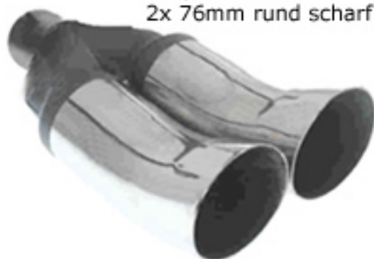
DC / DTM-Look 2x 76mm rund scharf