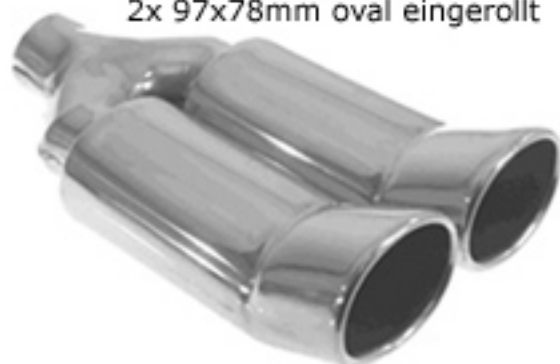
ER DTM-Look 2x 97x78mm oval eingerollt