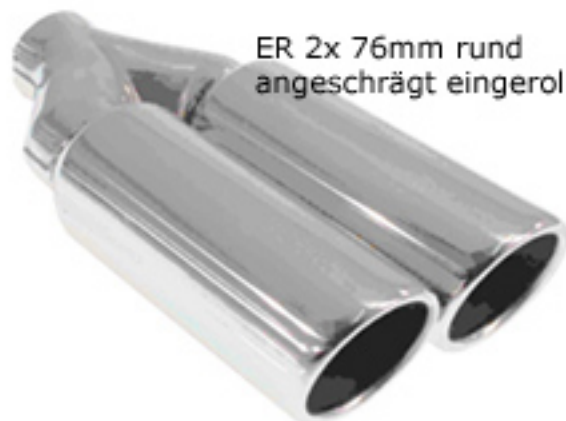
ER 2x 76mm rund angeschrägt eingerollt