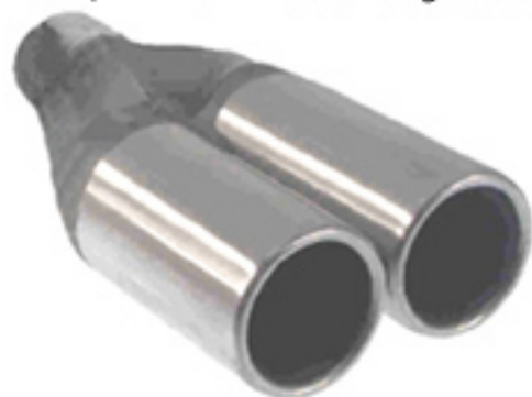
CC / 2x 76mm rund eingerollt