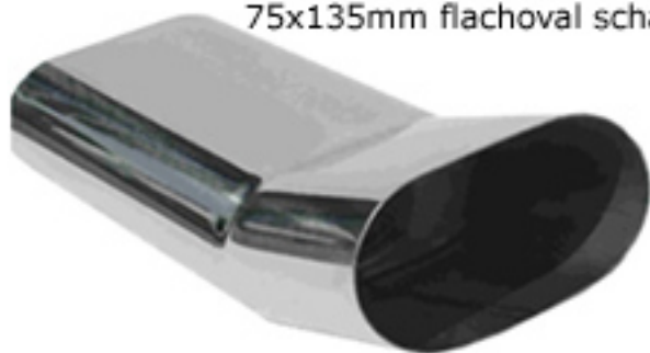
ER DTM-Look 75x135mm flachoval scharf