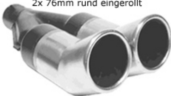
DC-1 / DTM-Look 2x 76mm rund eingerollt