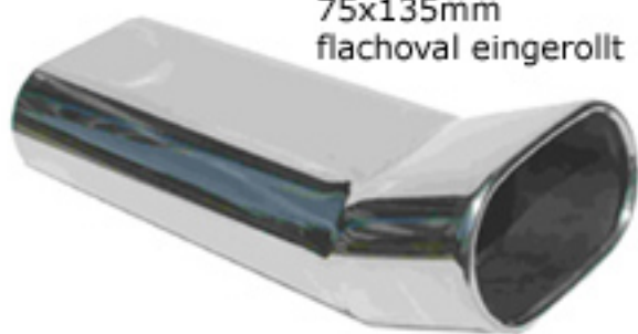
DV / DTM-Look 75x135mm flachoval eingerollt